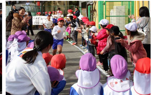
げんき保育園児のかわいい応援