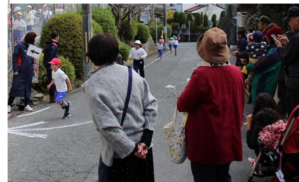
声援に応えて走る児童

苦しくても自分の目標に向かって最後まで走り抜いたこの経験が、走るということだけでなくこれからの人生の辛いことから逃げずにがんばり抜く 自信 につながればと願っています。